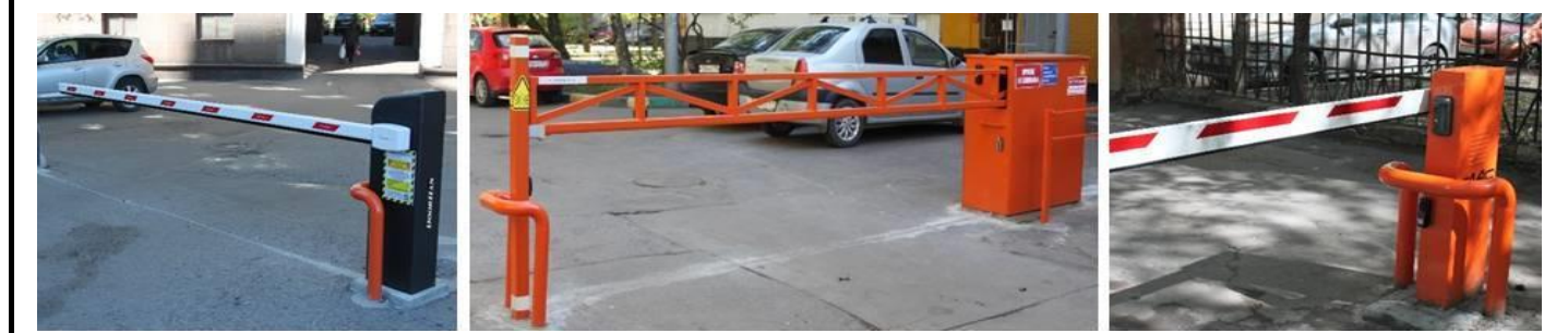
Фото 1 - ул. Дубровская 18 - шлагбаум Doorhan Barrier с защитой и Диспетчеризацией

Фото 2 - ул. Зеленодольская д.7 - Антивандальный шлагбаум сварной с защитой и Диспетчеризацией